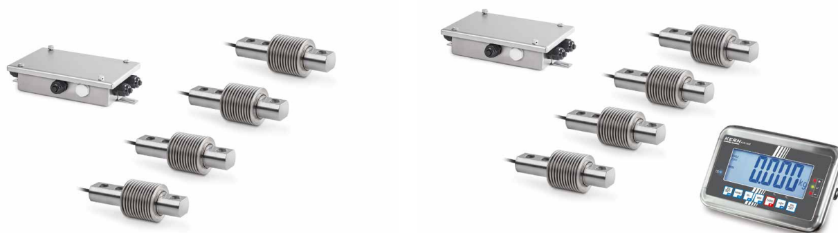
SAUTER CW RB

Kit de montaje de balanza SAUTER CW RB · CW KFNB